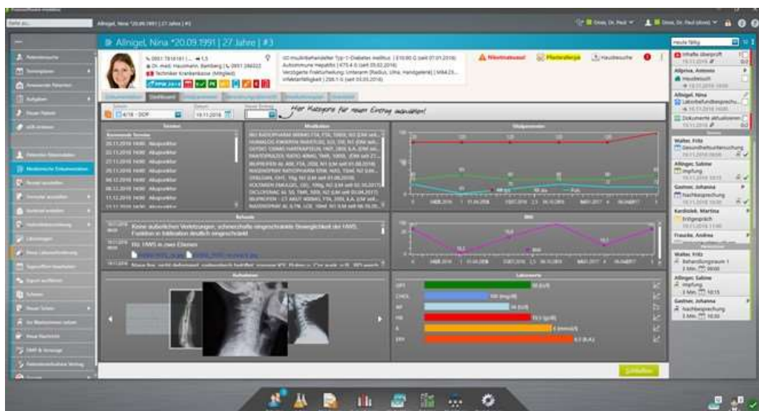
Das Aufgabenpanel rechts neben dem Dashboard.

Aufgabe. Der Arzt ruft dann aus der Aufgabe heraus per Mausklick den Laborbericht auf. Auch das Hinterlegen von Checklisten ist möglich – so wird die Aufgabe in einzelne Schritte zerlegt. Eine Checkliste für die Patientenneuaufnahme könnte etwa die Aufgabenschritte enthalten, erstens vom Patienten den Anamnesebogen ausfüllen, zweitens die Datenschutzerklärung sowie drittens die Einverständniserklärung zur Übermittlung von Daten unterschreiben zu lassen. Das Checklistenfeld ist in der Aufgabe enthalten, sodass der „Erlediger“ immer sofort den nächsten anstehenden Schritt sieht. Wiederholungs- und Routineaufgaben wie das Überprüfen des Notfallkoffers lassen sich ebenso einfach erstellen und mit Fälligkeiten versehen. So können ein Datum, auf Wunsch mit Uhrzeit, oder ein Zeitraum als Fälligkeitstermin definiert werden. Ist eine Aufgabe erledigt, genügt ein Mausklick. Kommt bei der Erledigung etwas dazwischen, wird ein Kommentar hinzugefügt oder die Aufgabe geblockt. Ist eine Aufgabe dringender als gedacht, ändert man einfach die Priorität über die rechte Maustaste.